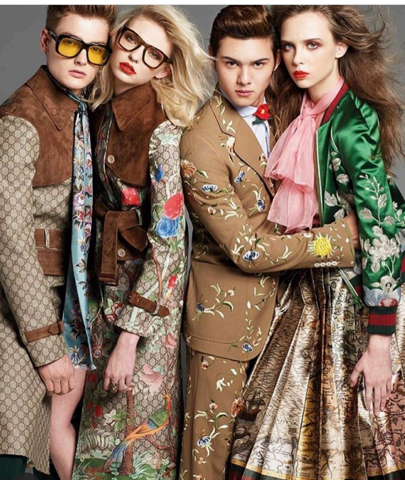
VOGUE 'Taiwan 【GUCCI】