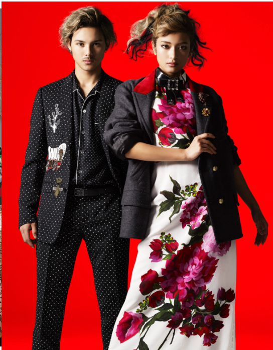
VOGUE 'Taiwan 【Dolce&Gabbana】