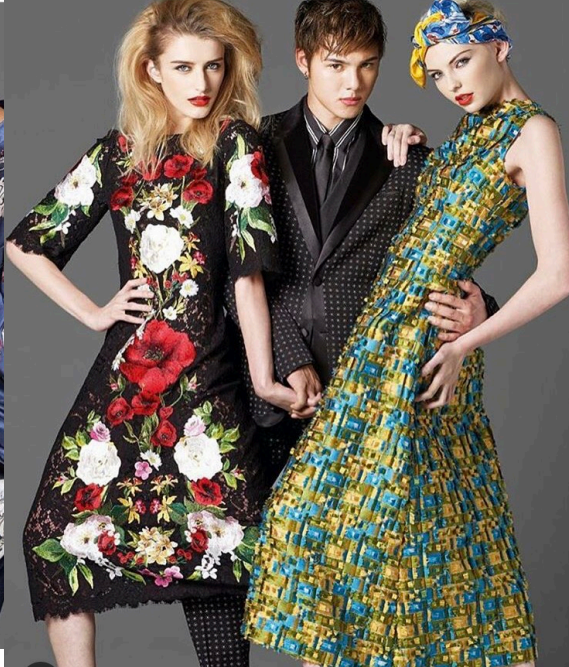
VOGUE 'Taiwan 【Dolce&Gabbana】